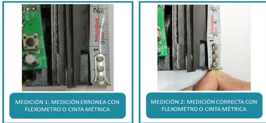
Figura 1: Del lado izquierdo tenemos una medida errónea dado que el flexómetro tiene una variación de movimiento de 1/16 in. Del lado derecho tenemos una medición correcta con el flexómetro dado que el usuario ajusta con sus dedos la variación del instrumento.

Respecto a la cancha: El participante deberá medir la trayectoria que trazó, con flexómetro o cinta métrica. Tomará dos medidas de ésta (ancho y largo).