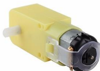
Figura 1: Motores permitidos en la competencia.