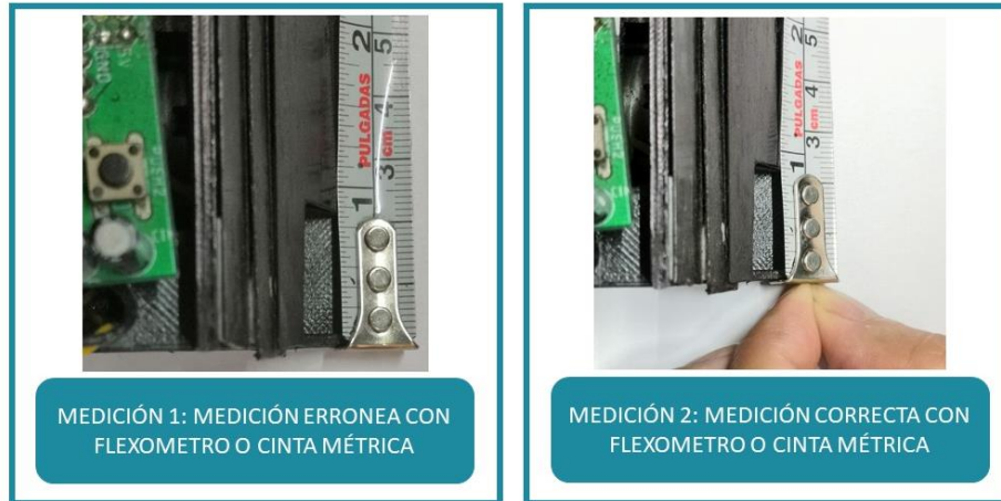
Figura 2: Del lado izquierdo tenemos una medida errónea dado que el flexómetro tiene una variación de movimiento de 1/16 in. Del lado derecho tenemos una medición correcta con el flexómetro dado que el usuario ajusta con sus dedos la variación del instrumento.

Respecto al dohyo: El participante deberá medir su dohyo con flexómetro o cinta métrica. Tomará dos medidas de éste, como se muestra en la siguiente imagen.