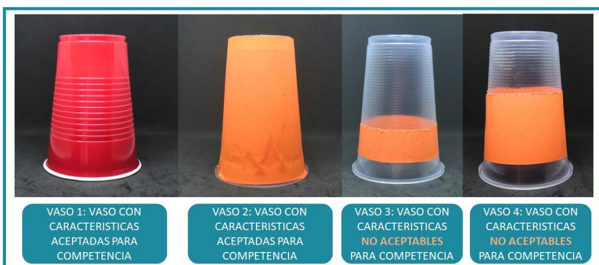
Imagen 1: Ejemplo de vasos aceptables y no aceptables para la competencia.

En la siguiente imagen se muestran varios casos de vasos que se consideran oficiales para la competencia, así como algunos que no lo son.