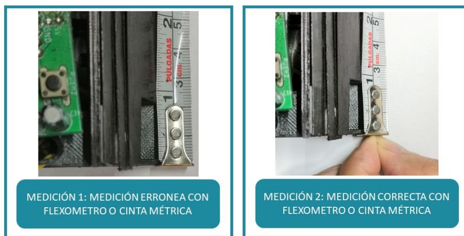
Figura 3: Del lado izquierdo tenemos una medida errónea dado que el flexómetro tiene una variación de movimiento de 1/16 in. Del lado derecho tenemos una medición correcta con el flexómetro dado que el usuario ajusta con sus dedos la variación del instrumento.

Por otra parte, el competidor tendrá que mostrar a la cámara que efectivamente esta usando los motores permitidos.