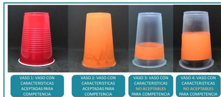
Figura 2: Ejemplo de vasos aceptables y no aceptables para la competencia.

En la siguiente figura se muestran varios casos de vasos que se consideran oficiales para la competencia, así como algunos que no lo son.