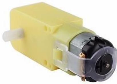
Figura 1: Motores permitidos en la competencia

NOTA: El incumplimiento de alguno de estos puntos será motivo de descalificación del robot en la competencia.