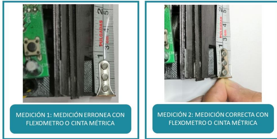
Figura 2: Del lado izquierdo tenemos una medida errónea dado que el flexómetro tiene una variación de movimiento de 1/16 in. Del lado derecho tenemos una medición correcta con el flexómetro dado que el usuario ajusta con sus dedos la variación del instrumento.

Respecto al dohyo: El participante deberá medir su dohyo con flexómetro o cinta métrica. Tomará dos medidas de éste, como se muestra en la siguiente imagen.