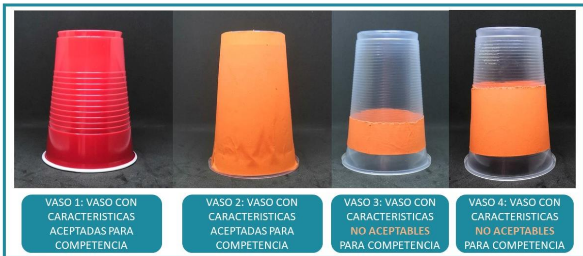
Imagen 1: Ejemplo de vasos aceptables y no aceptables para la competencia.

En la siguiente imagen se muestran varios casos de vasos que se consideran oficiales para la competencia, así como algunos que no lo son.